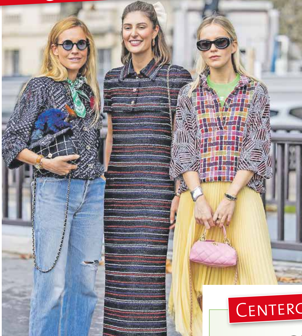
Frühjahrsmode 2024: Zur Spring-Saison kombinieren wir Retro-Pieces mit modernen Elementen und pastelligen Farben

• Klar: In der Mode kommt alles irgendwann wieder. Doch dass wir uns an dem Kleidungsstil unserer Großväter orientieren, ist tatsächlich ein neuer Trend. Heißt: Im neuen Jahr setzen Streetstyle-Profis und Designerinnen ganz