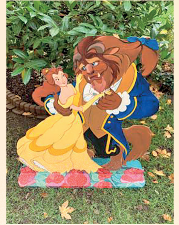
DIE SCHÖNE UND DAS BIEST