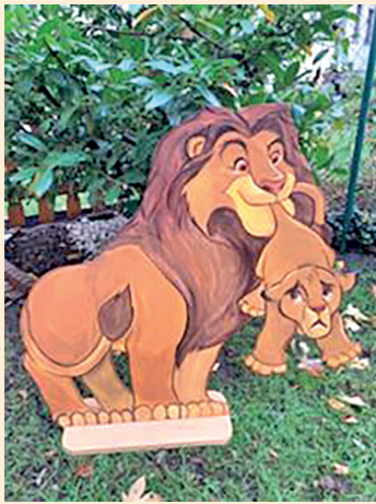
KÖNIG DER LÖWEN