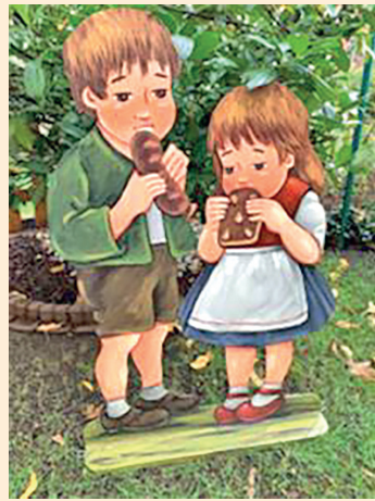
HÄNSEL UND GRETEL