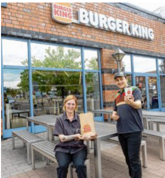
Burger King hat einen Freisitz vor der Filiale eingerichtet.

Burger King hat die Freiluftsaison eingeläutet. Neuerdings können die Besucher die Leckereien von Burger-King auch draußen vor der Filiale verspeisen. Bei milden Temperaturen und einer leichten frischen Brise eine willkommene Alternative zur Indoor-Gastronomie.