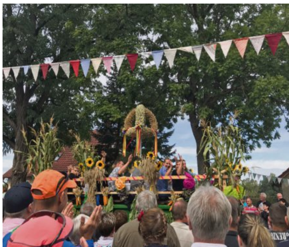
Foto: Brandenburger Dorf- und Erntefest 2019 in Passow