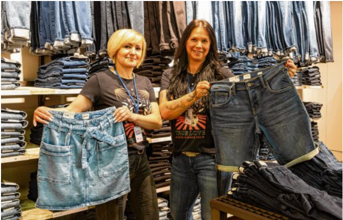
Schick, trendy und eine super Qualität: Jeans von Mustang.

mit Straight, Tapered oder Boot Jeans voll im Trend.