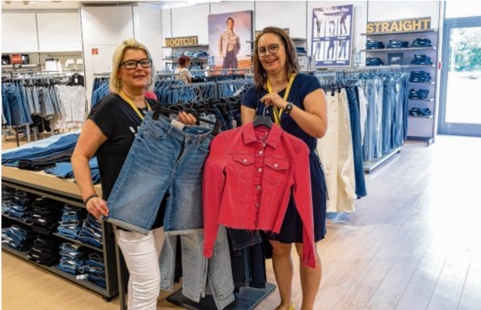
C & A setzt seit Jahrzehnten auf Jeans.

Vielfalt von Formen und Schnitten: Von hüftbetont über die lockere Passform der 80er Jahre bis hin zur flexiblen Legging-Form.