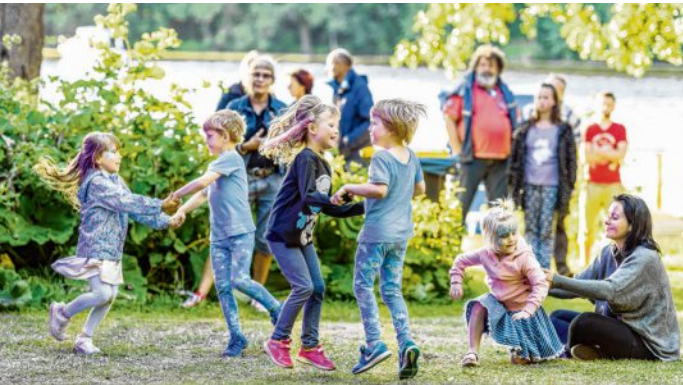
Ausgelassene Stimmung herrscht auch bei den jüngsten Besuchern.