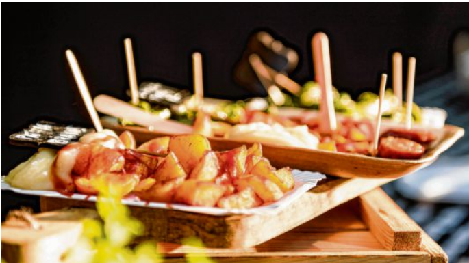
Streetfood-on tour: Hier kann man kulinarisch um die Welt reisen.

gesellschaftskritisch. Zudem gibt es an allen Tagen auf der gesamten Festivalfläche und auf den Neben Bühnen eine Vielzahl von Theater- und Artistikaufführungen. Und als weiteren permanen-