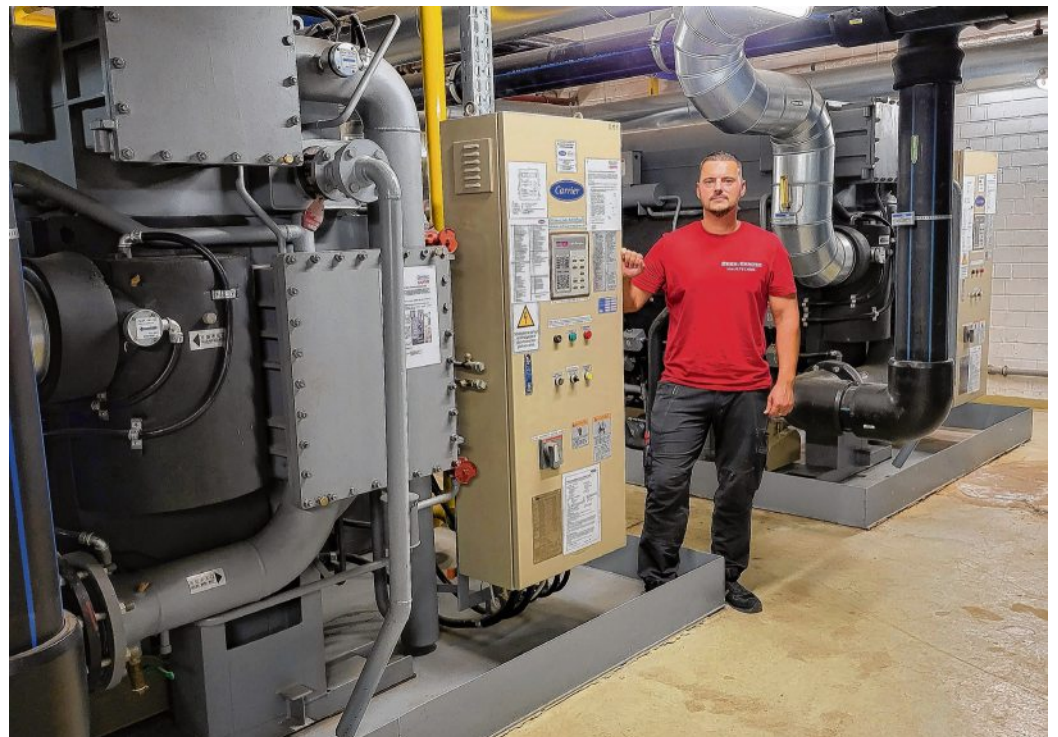
Moderne und energiesparende Technik sorgt für ein prima Klima im Oder-Center.