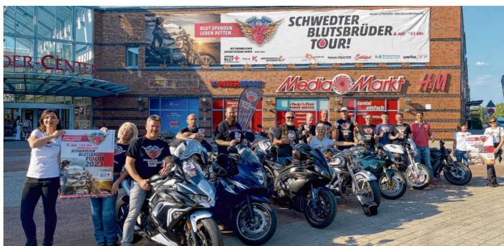
Die Blutsbrüder sind wieder für einen guten Zweck unterwegs.

Am 8. Juli startet die 15. Blutsbrüder tour. Zu der traditionellen Veranstaltung werden Hunderte Biker aus Deutschland und Polen zur Motorradausfahrt durch die Uckermark und vor allem zum Blutspenden erwartet. Auch in diesem Jahr wird der Blutspendendienst des DRK Nordost direkt in der Mitte des Oder-Centers die außergewöhnliche Spendenaktion in Schwedt durchführen. Von 11 bis 15 Uhr steht das DRK-Team zum „Anzapfen“ bereit, viertelstündliche Termine werden bereits im Vorfeld online und telefonisch vergeben. Jeder Spendewillige kann sich ab sofort für ein Zeitfenster registrieren lassen: Kostenlose Telefonhotline 0800 11 949 11 oder terminreservierung.blutspende-nordost.de. Der Verein und das DRK-Team weisen ausdrücklich darauf hin, dass jeder gesunde Mensch ab 18 Jahren an diesem Tag willkommen ist zum Spenden. Gerade in