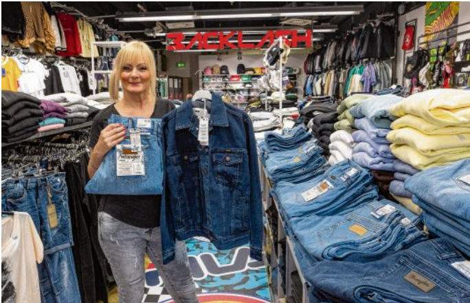
Die gute alte Wrangler, es gibt sie wieder bei Backlash.

Wrangler zu einem besonderen Stück Mode werden lassen.