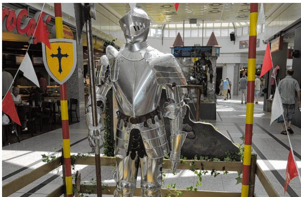
Die Ritter sind bald wieder los im Oder-Center.

dem Spaß am Spielen vermitteln diese Aktion immer auch Informationen über geschichtliche Details. Die Fantasie der Kinder wird angeregt und ihre Kreativität gefördert.