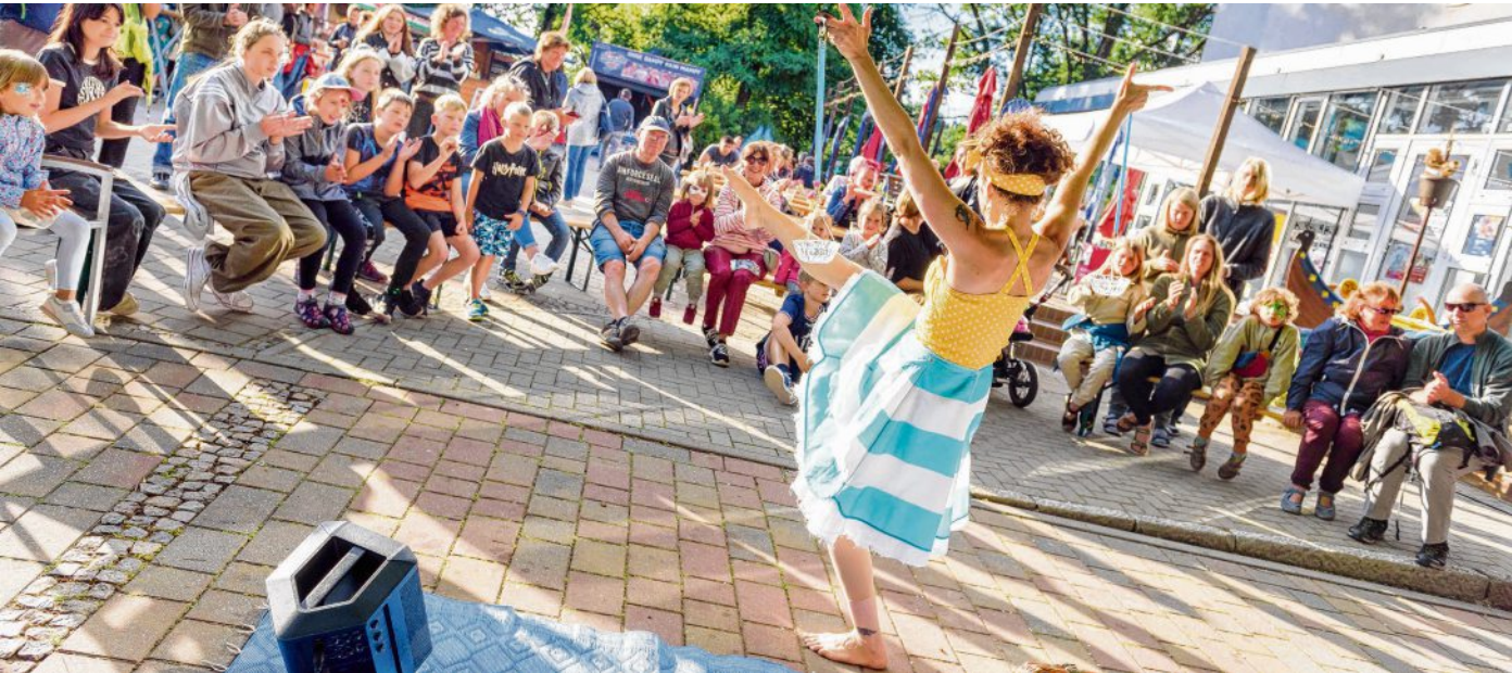
Straßentheater- und Artistikvorführungen ziehen das Publikum auf dem gesamten Festivalgelände in ihren Bann.