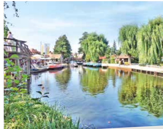
Cottbus: Zauber im Spreewald

Gehören Sie zu den Leuten, die gerne vorher wissen, was auf sie zukommt? Dann üben Sie schon einmal fleißig und flüssig, diesen Satz auszusprechen: „Der Cottbuser Postkutscher putzt den Cottbuser Postkutschkasten.“ Oder gehören Sie zu den Leuten, die Überraschungen lieben? Dann sollten Sie erst recht an Bord kommen, denn Ihr Spree-Waldhotel Cottbus hält mehr als eine davon für Sie bereit und ist für sich genommen schon eine Attraktion. Birkenstämme wachsen hier mitten im Restaurant aus dem Boden. In manchen Zimmern scheinen die Möbel von einem Waldschrat aus Fundholz gemacht, die Waschbecken sind aus Flusstein, Fußböden und Wände zieren rustikale Holzplanken. Ungeheuer schön wird auch der Rest der Reise, auf der wir uns einem romantischen Fortbewegungsmittel bedienen: ein typischer Spreewaldkahn stakt durch die Kanäle, während Glühwein und Spreewaldgeschichten uns zu Kopf steigen. Mit dem Besuch der wunderschönen Spreewaldweihnacht in Lehde und Lübbenau und einem augenzwinkernden „Gurkenseminar“ erleben wir weitere Attraktionen auf der Spreewaldreise.