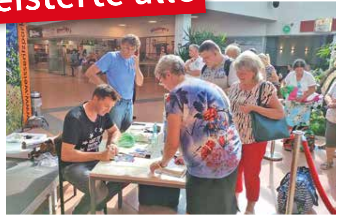
Lucas Cordalis nahm sich im Weißeritz Park Freital viel Zeit für seine Fans.