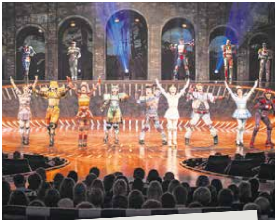
Bochum: Starlight Express-Theater

In 33 Jahren spielten insgesamt 826 Künstler aus 36 Nationen mehr als 12.000 Vorstellungen in Bochum – absoluter Rekord! Bereits 2010 erhielt STARLIGHT EXPRESS für damals 13 Millionen Zuschauer von „Guinness World Records, London“ den Titel des erfolgreichsten Musicals weltweit an einem Standort. Inzwischen zählt das Musical weit über 17 Millionen Besucher. Zum 30. Jubiläum 2018 überarbeitete Komponist und Schöpfer Andrew Lloyd Webber die rasante Rollschuh-Show vollständig. Lassen Sie sich von der Geschichte um die liebenswerte Dampflok Rusty verzaubern, die gegen scheinbar übermächtige Gegner kämpfen muss und das Herz des schönen Erste-Klasse-Waggons Pearl gewinnen möchte. Tauchen Sie ein in eine faszinierende Welt aus mitreißender Musik, atemraubender Geschwindigkeit und erleben Sie das Erfolgsmusical noch rasanter und moderner als alles, was Sie jemals auf einer deutschen Bühne gesehen haben! Ein rasantes Rollschuh-Musical für die ganze Familie! Erleben Sie eine grandiose Show, verbunden mit einer Stadtrundfahrt am nächsten Tag! Ideal als Geschenkidee!