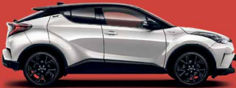
C-HR FLOW TURBO 4

85 kw (116 PS), 6-Gang-Schaltgetriebe, Klimaautomatik, Multimediasystem, Rückfahrkamera, Bluetooth, Licht- und Regensensor, Spurhalteassistent, uvm.