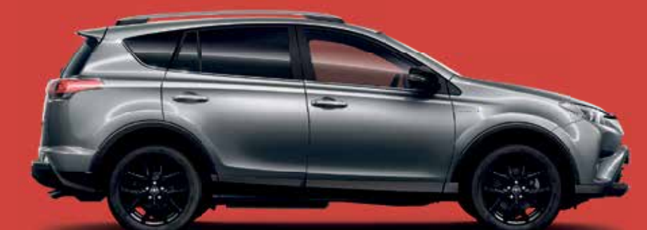
RAV4 TEAM D (4x2) 5 HYBRID

Systemleistung: 145 kw (197 PS), Automatikgetriebe, LED-Scheinwerfer, Einparkhilfe v+h, Rückfahrkamera, adaptive Geschwindigkeitsregelung, Navi, el. Heckklappe, Lenkradheizung, uvm.