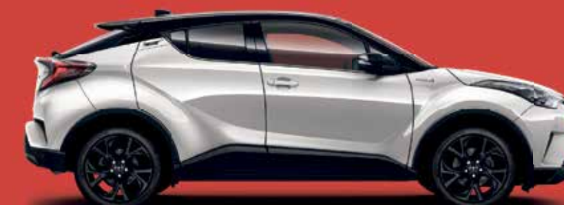
C-HR FLOW TURBO 4

85 kw (116 PS), 6-Gang-Schaltgetriebe, Klimaautomatik, Multimediasystem, Rückfahrkamera, Bluetooth, Licht- und Regensensor, Spurhalteassistent, uvm.