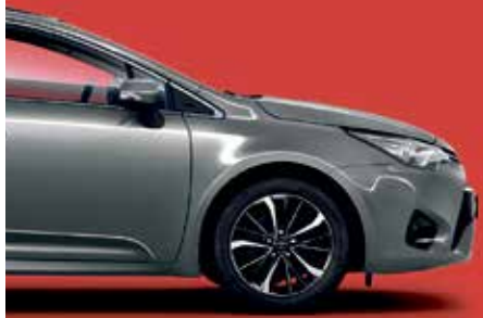
YARIS D 3

Qualität und Hybridtechnologie so günstig wie nie!