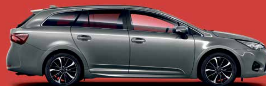
AVENSIS TS TEAM D 3

108 kw (147 PS), 6-Gang-Schaltgetriebe, Combi, LED-Scheinwerfer, Navi, Sitzheizung, Multimediasystem, Rückfahrkamera, Klimaautomatik, uvm.