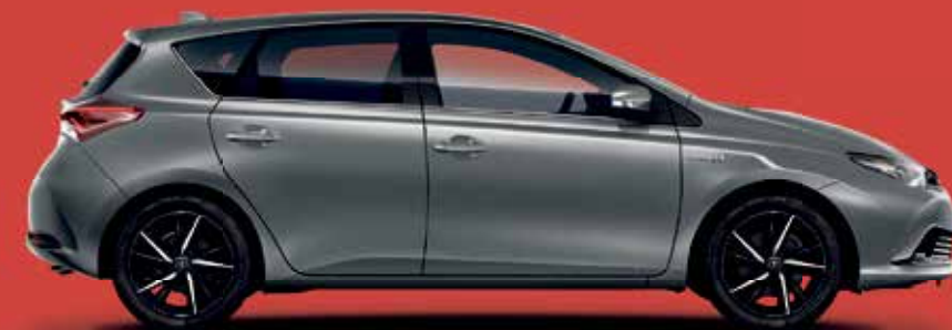
AURIS COOL 2 HYBRID

Systemleistung: 100 kw (136 PS), Automatikgetriebe, 5-Türer, Klimaanlage, Zentralverriegelung, el. Fensterheber, Audio-system, Bluetooth, Lichtsensor, uvm.