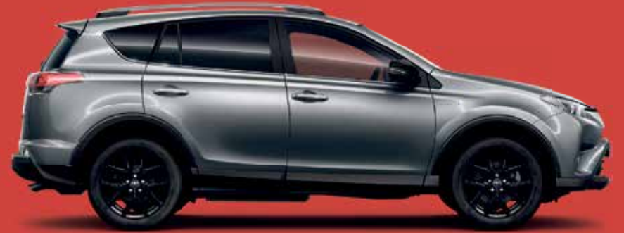
RAV4 TEAM D (4x2) 5