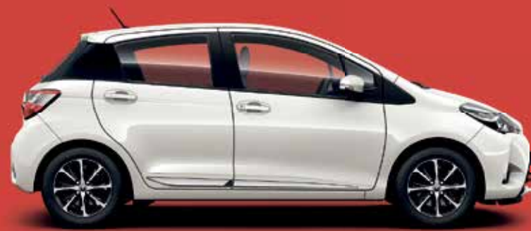
YARIS COOL & SOUND 1

mit Preisvorteilen von bis zu 12.600,- Euro*.