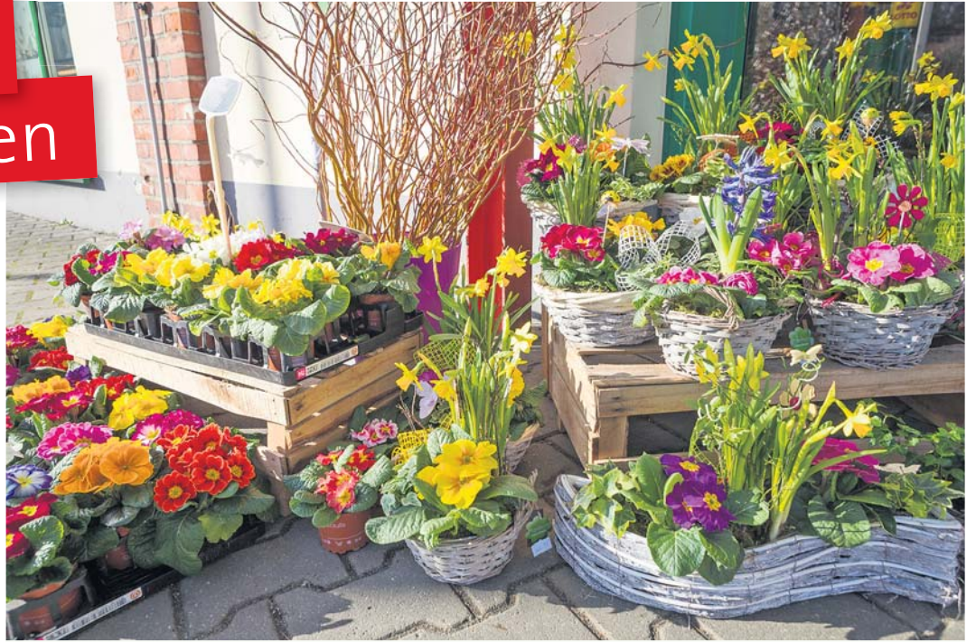
Schon am Eingang A zum Center begrüßt uns ein Blumengruß von Florizz. Primeln, Narzissen und Hyazinthen verbreiten nicht nur Farbenpracht, sondern auch einen kräftigen Frühlingsduft.

und die ersten Krokusse recken ihre Blütenköpfe empor. Und auch im Weißeritz Park lässt der Lenz schon grüßen. Wir waren dem Frühling auf der Spur und fanden ihn an den verschiedensten Ecken und in nahezu allen Geschäften. Hier eine kleine Auswahl, die Sie anregen soll, selbst auf die Suche zu gehen.