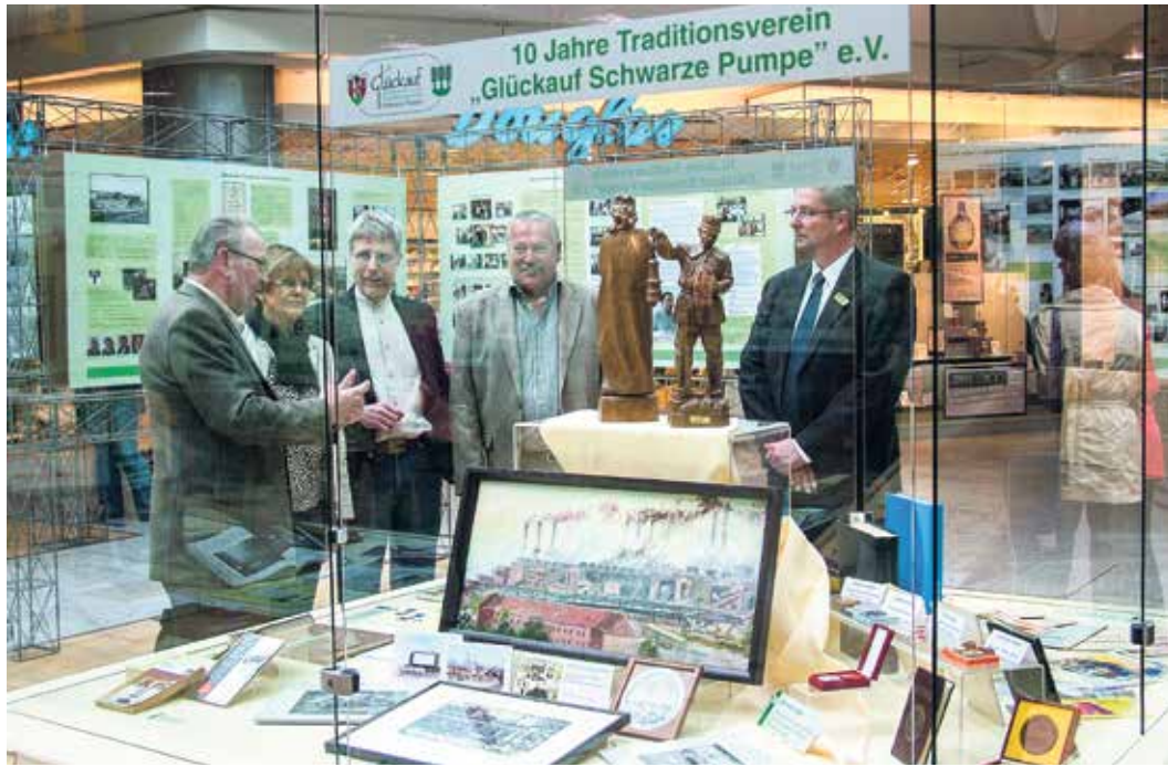
GEMEINSCHAFTSWERK: Der Traditionsverein „Glückauf Schwarze Pumpe“, die Bergbau(folge)unternehmen LMBV und Leag sowie die ASG Spremberg steuern das Inhaltliche bei; die Lautaer Werbeagentur Siegel gestaltet die Ausstellung. Links: eine schon gehaltene Schau, rechts: aktuelles Logo.

Unser Drogeriefachmarkt im Ex-Centrum öffnet nicht mehr ab 9 Uhr, sondern ist montags bis freitags schon ab 8 Uhr für Sie da. Entspannter Einkaufen! ■ LCA