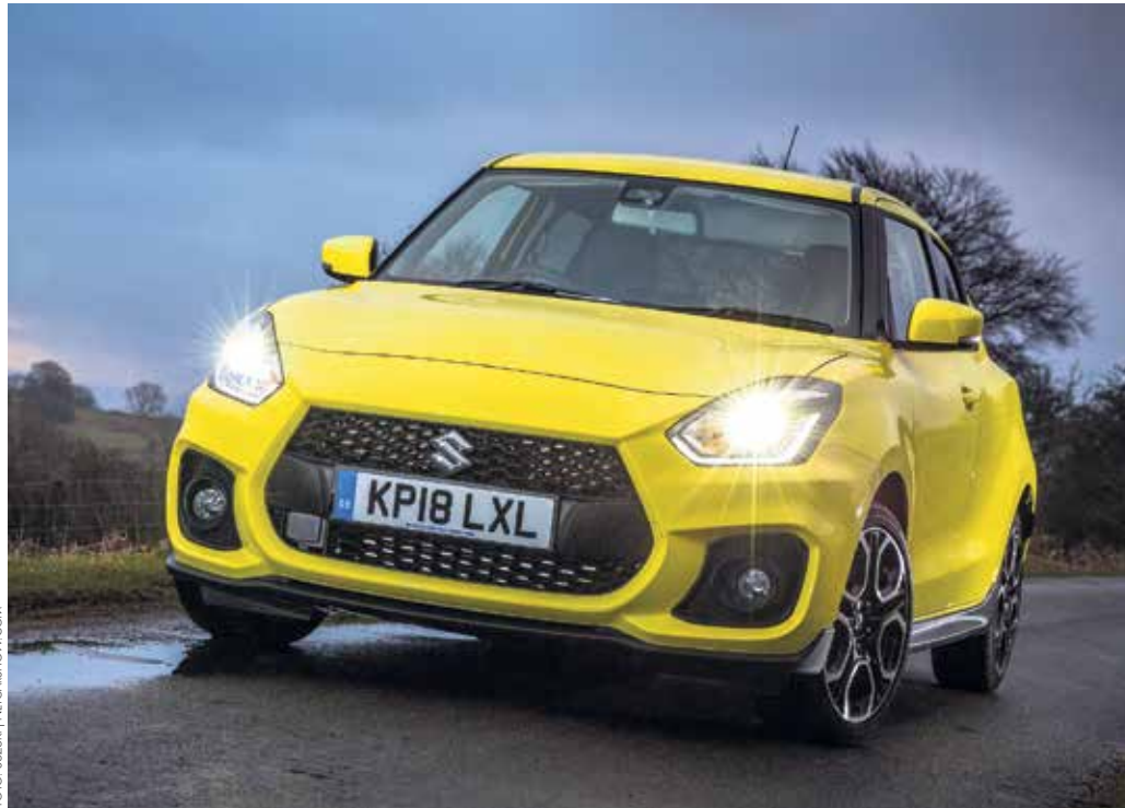
CHAMPION YELLOW: Das „Gelb des Meisters“ ist die wohl auffälligste Farbe, in der der neue Suzuki Swift Sport geliefert werden kann und unmissverständlich zeigt: Hier kommt einer, der's in jeder Situation echt drauf hat!

ten Formen der Genügsamkeit ist es, einen Suzuki Swift Sport in eine Serpentincurve zu werfen. Noch vor dem Scheitelpunkt folgt die Erkenntnis: Die Welt braucht diesen scharfen Kleinwagen, um sich zu erden – zwischen all den Hypercars mit vierstelligen PS-Zahlen und den dicken SUV mit Sportmotoren. Um wieder zu lernen, dass 140 PS Spaß machen können – bei kurviger Strecke und niedrigem Fahrzeuggewicht.“ Auto Bild belegt das mit Zahlen: „In 8,1 Sekunden sprintet er aus dem Stand auf Tempo 100, schafft 210 km/h Spitze. Dabei hängt er stets bissig am Gas, reagiert spontan und in jedem Gang aufs Gas. Mit der Sechsgang-Box macht Handarbeit richtig Spaß.“ Sportlichkeit, das versteht sich, geht bei Suzuki mit aktiver/passiver Sicherheit Hand in Hand. Begutachten Sie den Sportler jetzt im Lausitz-Center! ■ LCA