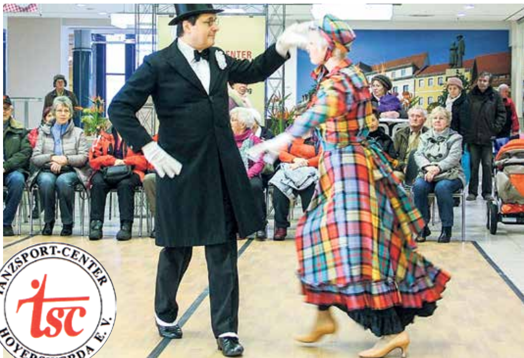
GERN GESEHENE GÄSTE: Die Hoyerswerdaer Tänzer zeigten im Lausitz-Center schon oft ihr Können sportlich ambitioniert, festlich oder humorvoll; hier bei einer Darbietung Altberliner Tänze im Ex-Centrum-Center-Teil.

Schon mehrmals waren die Tänzer des TSC (Tanzsportcenters) Hoyerswerda im Lausitz-Center zu Gast. Am 1. September, einem Sonnabend, ist das TSC einmal mehr im Lausitz-Center zu finden – beim „Tag der Offenen Tür“ von 10 bis 13 Uhr. Dabei wird das TSC sein Anliegen präsentieren: „Unser Tanzsportverein hat sich die tänzerische Ausbildung von Kindern und Jugendlichen im Bereich Turniertanzsport zur Hauptaufgabe gemacht. Es trainieren Aktive aus Hoyerswerda und Umgebung in unserem Trai-